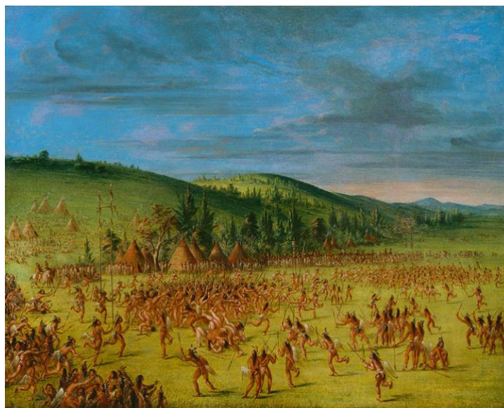
Rysunek 3.4. Początki gry lacrosse'a

Gra Lacrosse wywodzi się z Ameryki Północnej, gdzie pierwotnym celem było jej zastosowanie aby kształcić poziom militarny wśród pokolenia indiańskiego. Udział w dość brutalnej grze miał kształcić przede wszystkim mocne charaktery rdzennych mieszkańców. Podczas meczu na boisku o wielu hektarach udział brało od 100 do 1000 zawodników, którzy rywalizując ze sobą od wschodu do zachodu słońca, przy pomocy charakterystycznie zakrzywionego kija 9 zdobywali bramkę ograniczoną drzewami podając pomiędzy sobą piłkę wykonaną ze skóry jelenia(rysunek 3.4.). Z początkiem powstania gry jej techniki nie były do końca opracowane w związku z czym dochodziło do brutalnych sposobów zagrania.